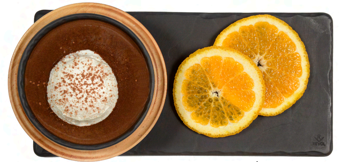
Ciocolată caldă À La Française