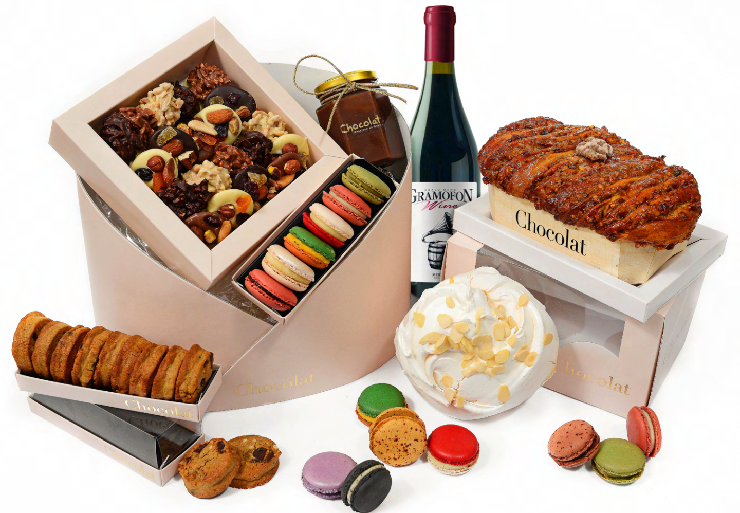
Surpriza lui Moș Crăciun 695 lei