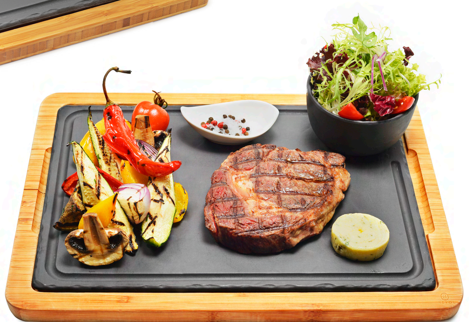
Platou antricot Argentina - 185 lei Legume proaspete la grătar, salată asortată și unt "Maitre d'Hotel" Argentine Beef entrecôte