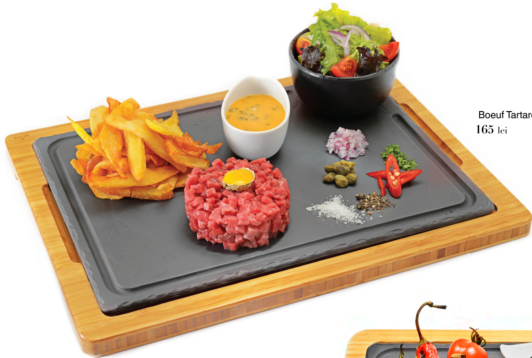
Boeuf Tartare 165 lei