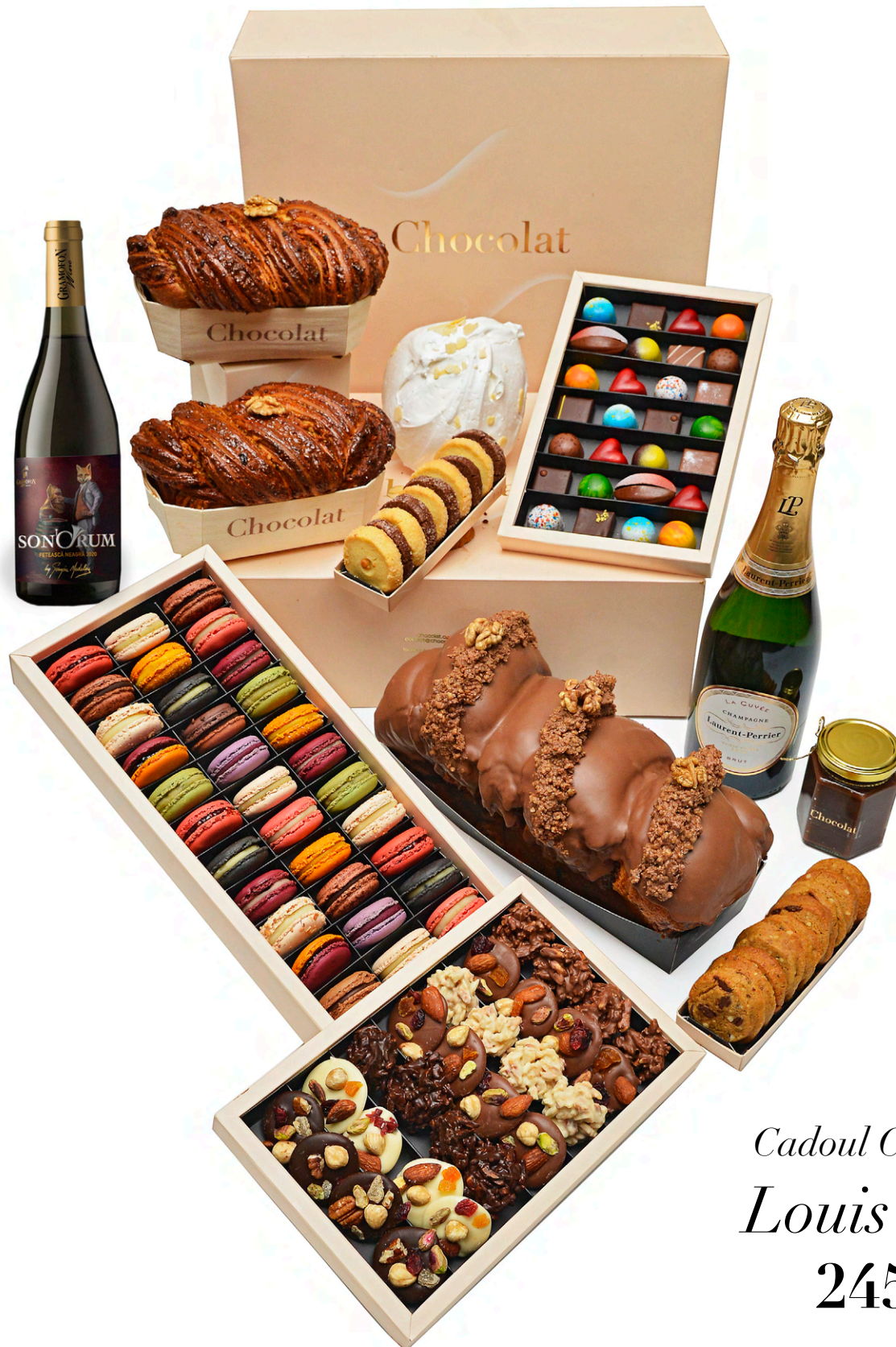
Cadoul Chocolat Louis XIV 2450 lei