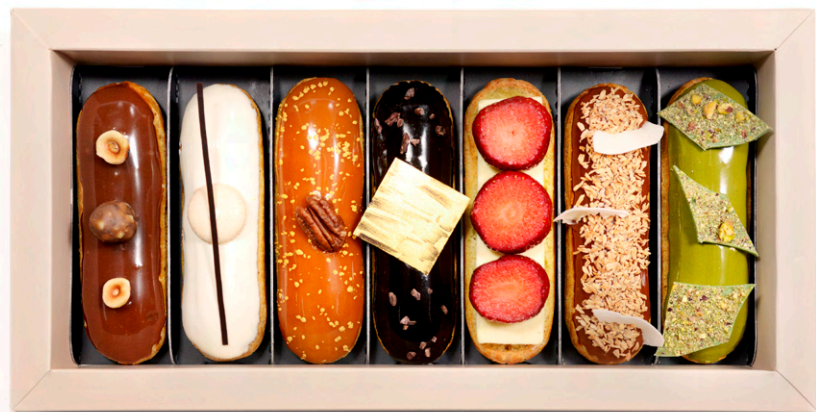
Cutie 7 Les Eclairs - 189 lei