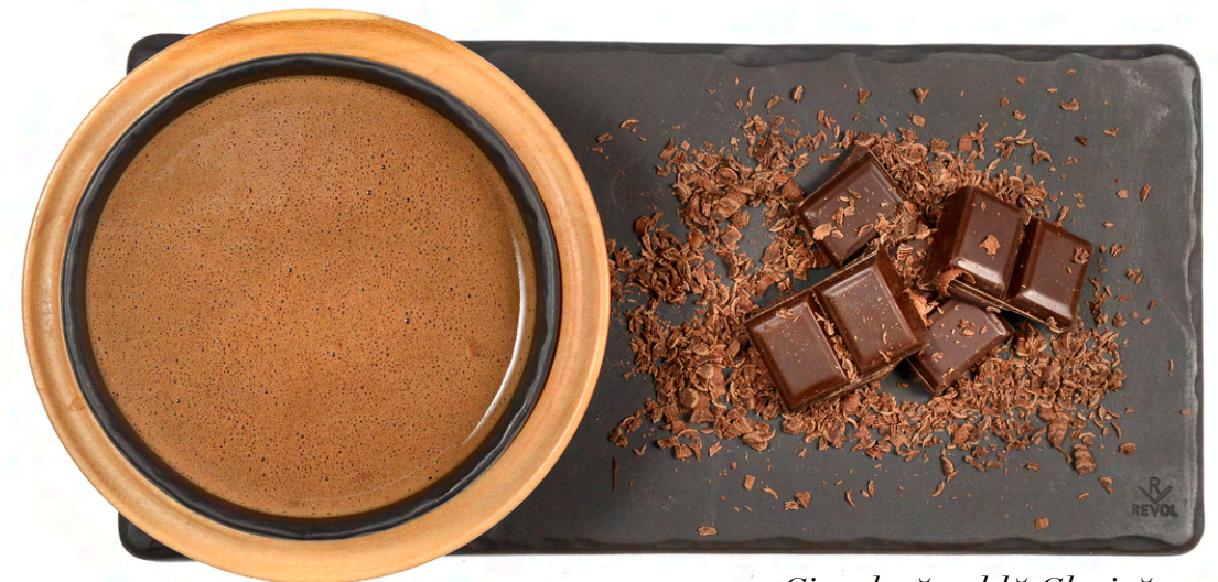
Ciocolată caldă Clasică