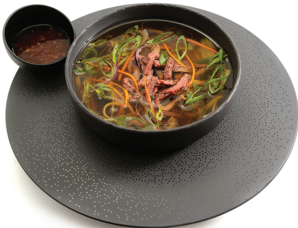
Supă de vită specialitatea maestrului bucătar - 59 lei Beef soup - master chef's speciality