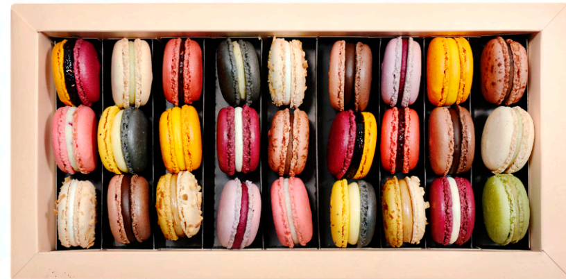
Cutie 24 Les Macarons - 299 lei