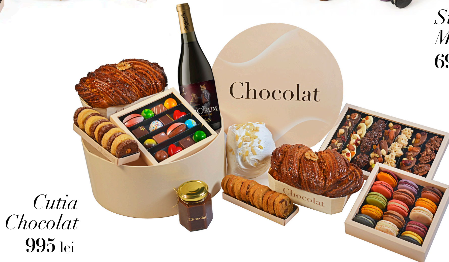
Cutia Chocolat 995 lei