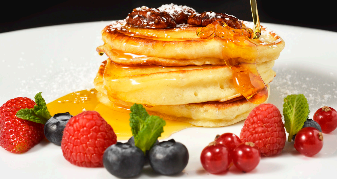
New York Pancakes