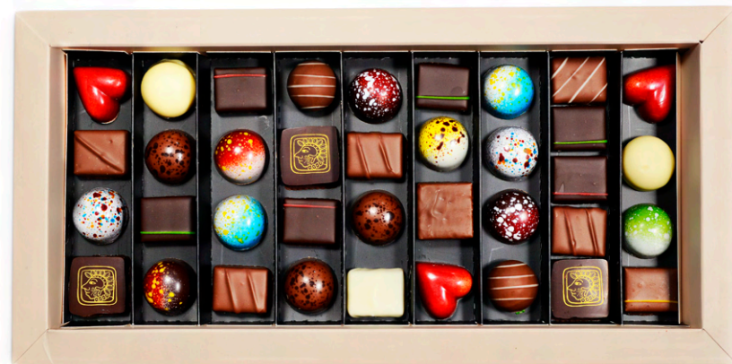
Cutie 300 g Les Pralines Belges - 195 lei