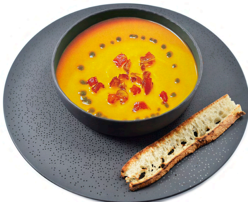
Cremă nectar de dovleac cu măr copt și crutoane aromate - 59 lei Pumpkin nectar cream, baked apple, flavored crutons