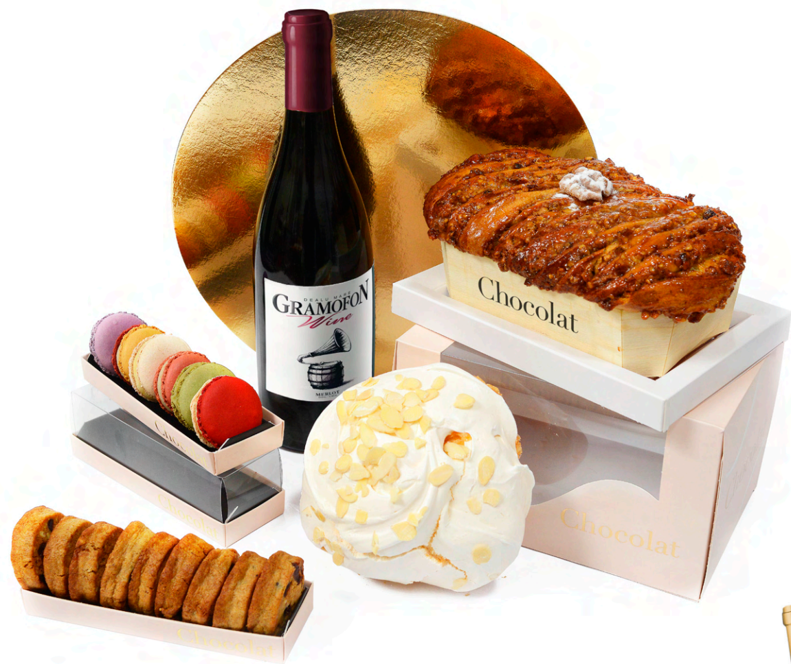
Esential 495 lei