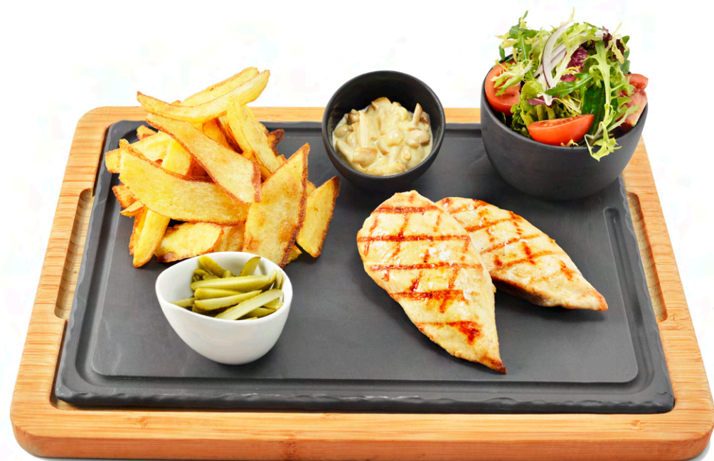
Platou piept de pui la grătar - 120 lei Cartofi prăjiți, sos de ciuperci cu smântână, crudități Grilled chicken breast