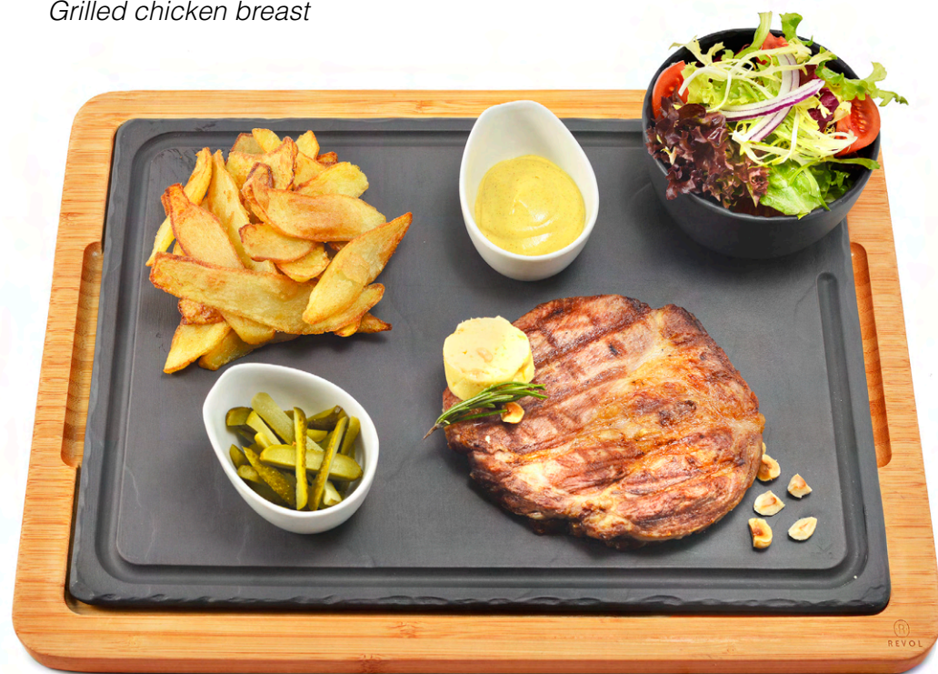
Platou medalion de Mangaliță - 185 lei Cartofi prăjiți, crudități, unt cu alune de pădure coapte Mangalica pork medallions